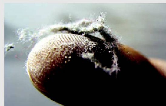
Более чистая производственная площадка