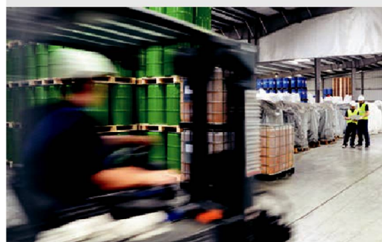
Снижение затрат на рабочую силу