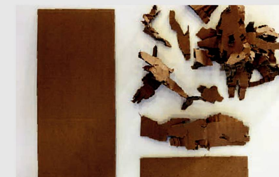
20-30%-е увеличение наполняемости пресс-контейнера