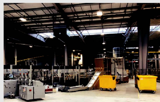
Требуется меньше места